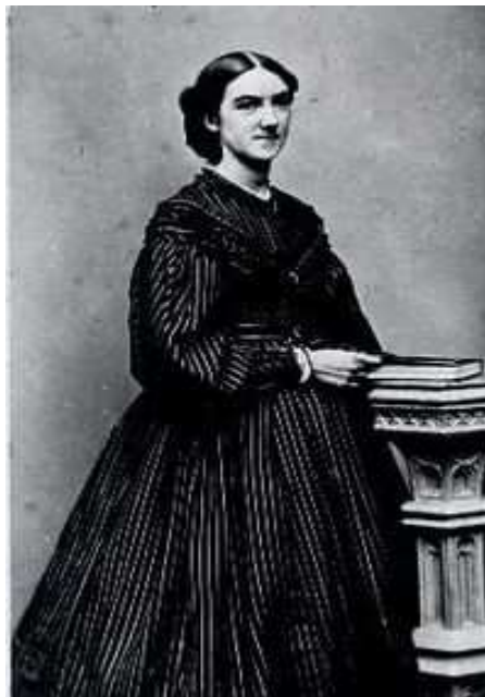
Abbildung 1: Ellen H. Richards: Initiatorin des Home Economic Movement ( http://en.wikipedia.org/wiki/ , zuletzt abgerufen am 12.12.2010)

Fach „Haushaltskunde“, in den Vereinigten Staaten von Amerika mit dem Fach „Home Economics“. Gegen Ende des 19. Jahrhunderts entsteht in den Vereinigten Staaten bereits der universitäre Wissenschaftszweig für den Haushalt, währenddem in Europa eine kurze seminaristische Ausbildung als ausreichend angesehen wird (ebd., S. 26). Die akademisch gebildete Ellen H. Richards gilt als treibende Kraft der „Home Economics“ und initiierte das „Home Economic Movement“. Obwohl die Frauen in den Vereinigten Staaten im Vergleich zu den Frauen in Europa als selbständig gelten, akzeptieren die frühen Haushaltswissenschaften, die Idee der „Domesticity“, der weiblichen Sphäre, in der sich die Frau dem Mann unterzuordnen und sich aus den bürgerlichen und politischen Angelegenheiten herauszuhalten hat. Für die soziale Stabilität der Gesellschaft und den Erhalt der Demokratie scheint die naturgegebene Unterordnung der Frau unter den Mann als grundlegende Voraussetzung zu gelten (ebd., S. 27).