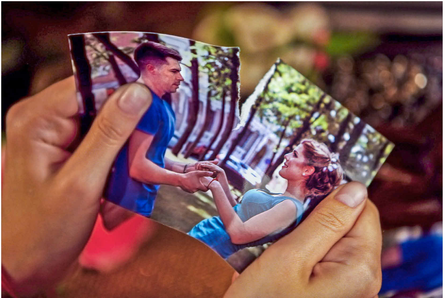
An eine Scheidung oder Trennung sind starke Emotionen geknüpft. Man muss sich von Vorstellungen lösen, die finanzielle und familiäre Situation muss neu bewertet werden.