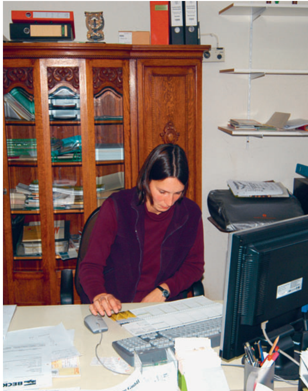
Jede Bäuerin sollte sich Gedanken über ihre Erwerbssituation und den sozialen Schutz machen.

Beim Mitunternehmertum wird die Bäuerin organisatorisch und rechtlich am stärksten eingebunden. Die Mitunternehmerin bewirtschaftet den Betrieb zusammen mit ihrem Ehemann. Sie unterscheidet sich von der Angestellten mit Lohnausweis dadurch, dass sie mitentscheidet, investiert und in vergleichbarem Ausmass unternehmerisch tätig ist wie ihr Ehemann. Kann sie ihr Mitunternehmertum gegenüber der AHV-Ausgleichskasse belegen, wird sie sozialversicherungsrechtlich als Selbstständigerwerbende anerkannt und registriert. Auch ohne schriftlichen Vertrag gilt das Mitunternehmertum als einfache Gesellschaft – mit allen Vor- und Nachteilen dieser Rechtsform. Wichtig zu wissen ist, dass in diesem Fall beide Gesellschafter (Landwirt und Bäuerin) den für den Anspruch auf Direktzahlungen erforderlichen Ausbildungsnachweis erbringen müssen.