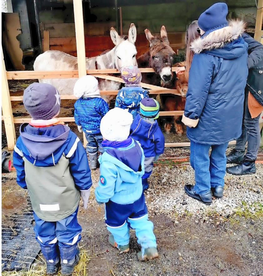
Die Hoftiere werden in das Betreuungsangebot auf dem Burehof Seelefride einbezogen.