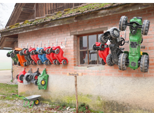
Das ist der Maschinenpark der Bauernhof-Spielgruppe.

Merkblatt des Kantons Aargau: www.diegruene.ch/merkblatt-aargau