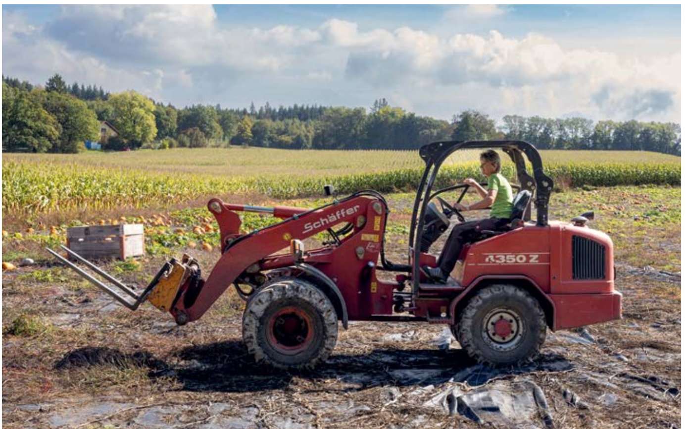
Heute nehmen Frauen in der Landwirtschaft eine klar definierte Position ein. Trotz dieser positiven Entwicklung bestehen aber weiterhin grosse Herausforderungen.

Ein wichtiger Fortschritt wurde mit der neuen Direktzahlungsverordnung erreicht. Ab 2027 ist der persönliche Versicherungsschutz für mitarbeitende Ehepartner:innen und eingetragene Partner:innen Voraussetzung für den Erhalt von Direktzahlungen in voller Höhe. Dieser Schritt ist ein politischer Erfolg, den der SBLV über Jahre hinweg mitgetragen und eingefordert hat. Gleichzeitig ist klar: Diese Regelung ist ein erster Schritt. Sie schützt bei Krankheit, Unfall, Invalidität oder Tod – ersetzt aber weder eine faire Entlohnung noch eine ausreichende Altersvorsorge. Deshalb setzt sich der SBLV weiterhin für klare finanzielle Verhältnisse, transparente Geldflüsse und ganzheitliche Beratungen für Paare ein, etwa bei Hofübernahmen, Investitionen oder der Nachfolgeplanung.