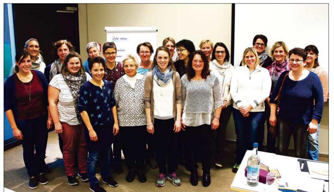
19 Landfrauen und Bäuerin erlebten mit Olympiasiegerin und Coach Tanja Frieden (hinten links) einen abwechslungsreichen und praxisorientierten Seminartag.