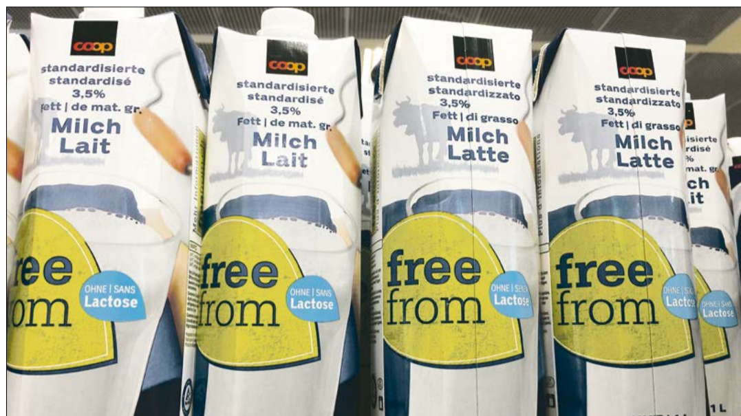
Der höchste Gehalt an Milchzucker findet sich in Milchpulver, Milch und Joghurts, Käse wird hingegen häufig gut vertragen.

Die häufigste Form ist eine teilweise Lactoseintoleranz, welche eine von zehn Personen betrifft. Diese kann natürlicherweise im Erwachsenenalter auftreten, wenn sich die Fähigkeit, Milchzucker durch das Enzym Lactase aufzuspalten, vermindert. Einige Darmerkrankungen können