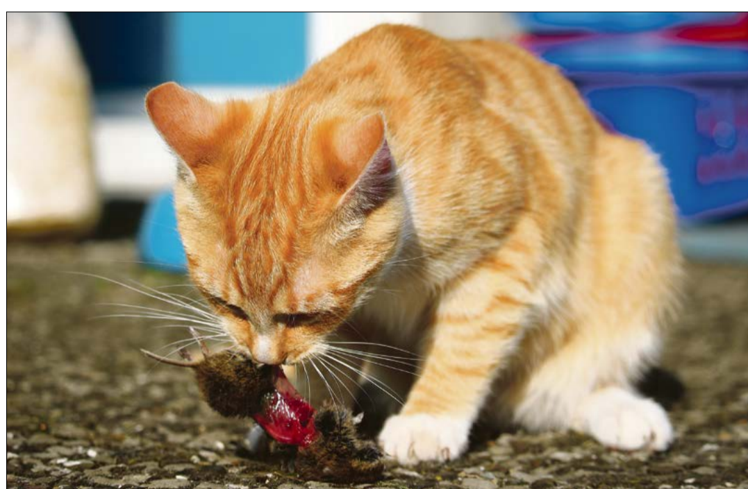
Nur eine gesunde und wohlgenährte Katze ist eine erfolgreiche Jägerin.

Wer eine Katze regelmässig füttert und sie von sich abhängig macht, gilt als ihr Halter. Dieses Prinzip gilt auch für streunende Katzen, die sich zum Fressen zu den eigenen Katzen auf dem Hof gesellen. Da die Jagd auf Mäuse allein Katzen nicht genügt, ist dafür zu sorgen, dass sie