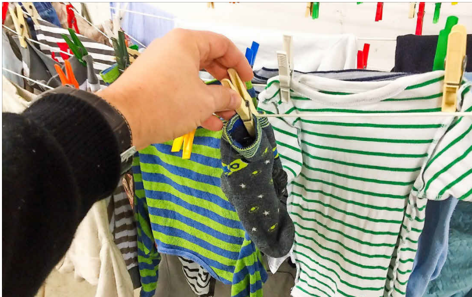
Hauswirtschaft geht weit übers Putzen und Wäschewaschen hinaus.

Mit Aktionen wird die Bevölkerung in allen Kantonen darauf sensibilisiert, dass Hauswirtschaft mehr als Kochen und Putzen umfasst, denn hauswirtschaftliches Wissen und Können ist grundlegend für den Alltag. Der SBLV ruft den Tag der Hauswirtschaft als Aktionstag ins Leben. Dafür will er Schulen, Klassen und Gruppen mit einbeziehen, private Initiativen zusammenbringen und mit Künstlerinnen und Exponentinnen aus Wirtschaft und Politik zusammenarbeiten. Der 21. März soll begeistern und Lust machen, wieder selber Hand anzulegen, sei es beim Kochen, Putzen, Waschen, Handwerken, beim Bügeln oder beim Erstellen eines Haushalt-