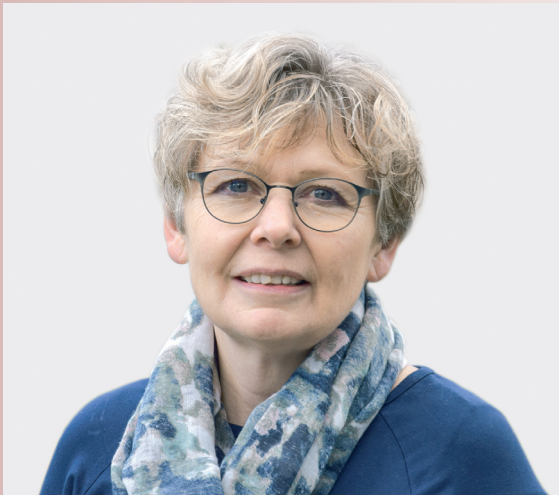
Christine Bühler , Präsidentin des Schweizerischen Bäuerinnen- und Landfrauenverbandes