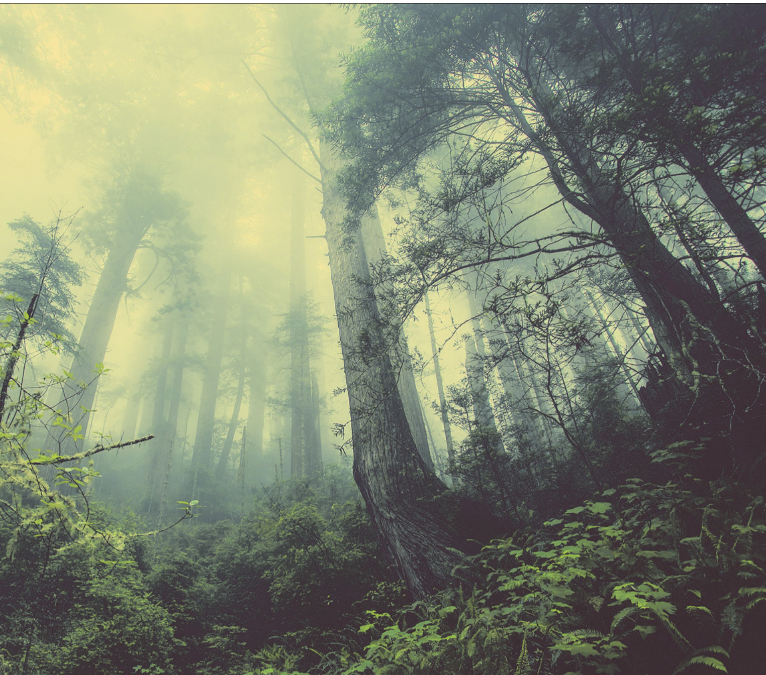
Im Wald stehen Bäume verschiedener Generationen. Das macht ihn wertvoll und lässt ihn idyllisch wirken. Auf den Höfen ist dieses Nebeneinander oft nicht derart idyllisch. Nicht zu vergessen ist, dass auch im Wald der «Jungwuchs» Platz braucht, um zu gedeihen.

war. Die schwächeren Glieder in der Generationengemeinschaft haben dann einfach still gelitten und die stärkeren Glieder haben ihre Macht ausgebaut. Heute melden alle ihre Bedürfnisse mehr an. Und das ist auch gut so. Jetzt gilt es, zu lernen, gute Gespräche über die unterschiedlichen Bedürfnisse zu führen.